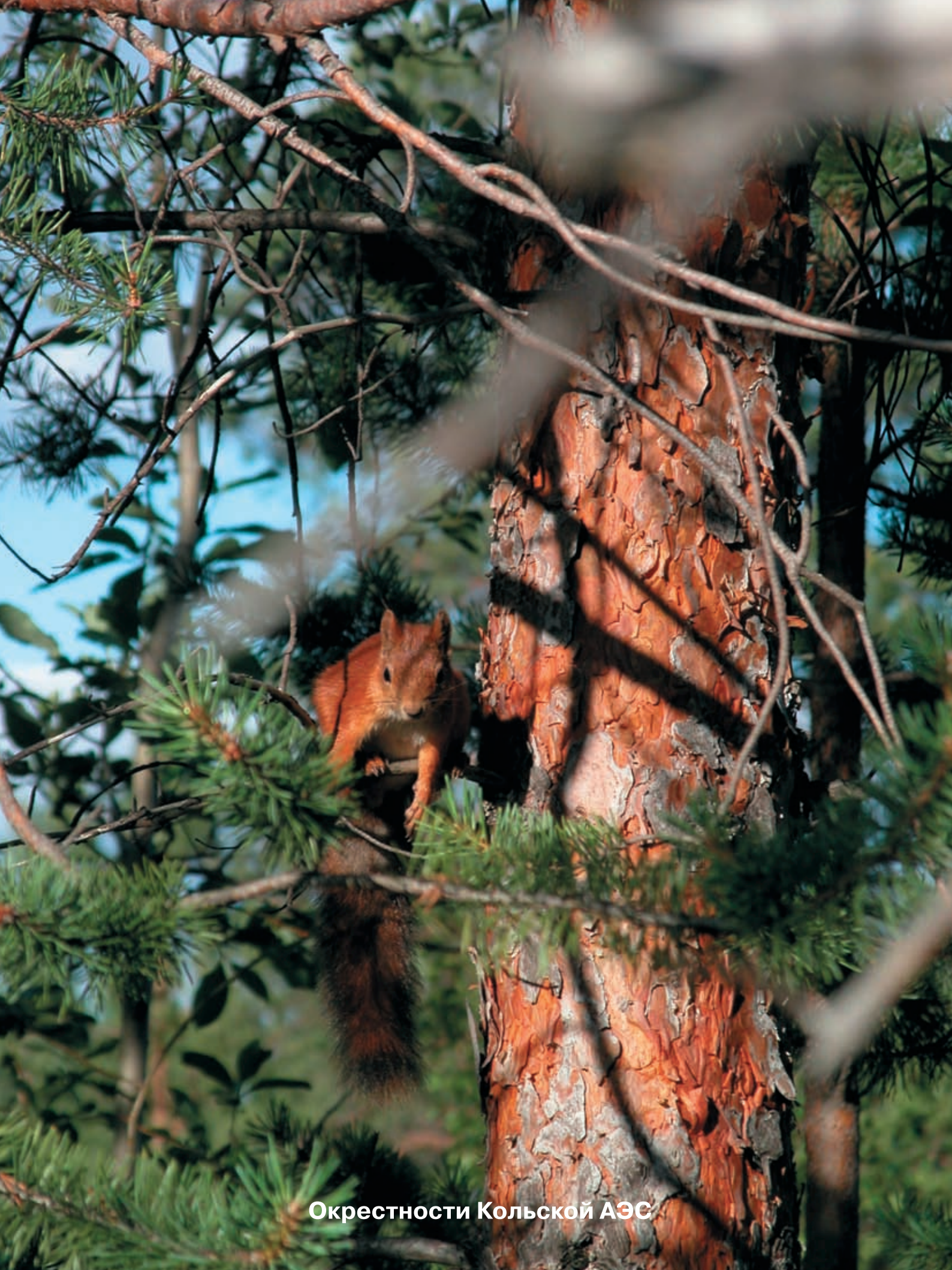
Окрестности Кольской АЭС