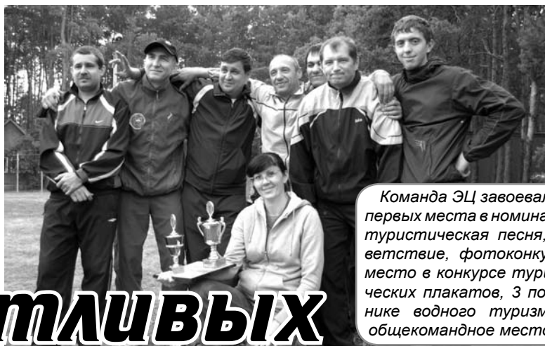
Команда ЭЦ завоевала 3 первых места в номинациях: туристическая песня, приветствие, фотоконкурс, 2 место в конкурсе туристических плакатов, 3 по технике водного туризма, III общекомандное место.

команды, понимаешь, насколько близким стал тебе этот человек за неполные три дня. Да и вообще люди на лоне природы ведут себя по иному, душевнее они, что ли становятся. Суетливость, нервозность с них слетает, от напускной важности тоже не остается следа,