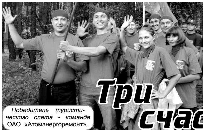
Победитель туристического слета - команда ОАО «Атомэнергоремонт».